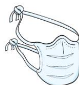
Máscara Cirúrgica (paciente durante o transporte)