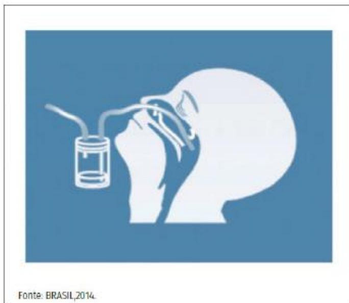
FIGURA 1 Ilustração da técnica para a coleta de aspirado nasofaríngeo